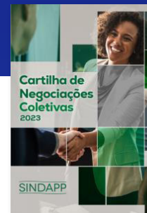
CARTILHA DE NEGOCIAÇÕES COLETIVAS - SINDAPP