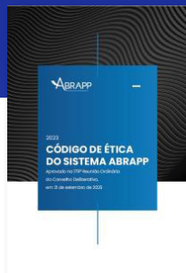
CÓDIGO DE ÉTICA DO SISTEMA ABRAPP

Abaixo, confira a lista de lançamentos de 2023: