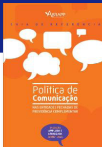
GUIA DE REFERÊNCIA POLÍTICA DE COMUNICAÇÃO NAS ENTIDADES FECHADAS DE PREVIDÊNCIA COMPLEMENTAR