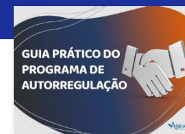
GUIA PRÁTICO DO PROGRAMA DE AUTORREGULAÇÃO