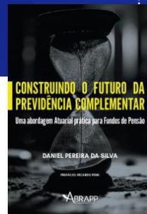
CONSTRUINDO O FUTURO DA PREVIDÊNCIA COMPLEMENTAR