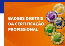
BADGES DIGITAIS DA CERTIFICAÇÃO PROFISSIONAL - ICSS